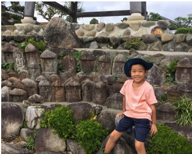
在土名物「お地蔵さん」